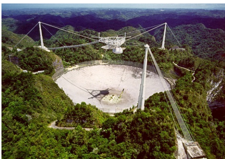
Fig. 3 Radiotelescopio di Arecibo

quali, in una forma di volontariato scientifico, mettono a disposizione il loro computer. La dinamica del progetto è la seguente: abbiamo detto che SETI@home ricerca possibili prove di trasmissioni radio da intelligenze extraterrestri, utilizzando i dati di osservazione rilevati dal radiotelescopio di Arecibo (Fig.3).