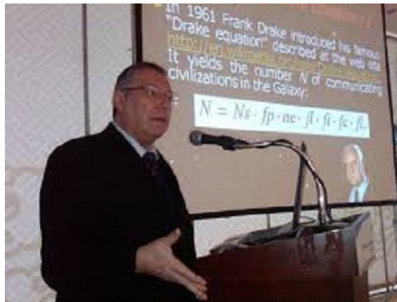
Fig.1 Prof. Claudio Maccone

Venerdì 27 Marzo 2016, a Parigi ha avuto luogo il Symposium on Search for Life Signatures (Simposio per la ricerca di vita nello Spazio) e nel corso dei lavori, la SETI Permanent Committee (Commissione Permanente del SETI) ha eletto Presidente Internazionale il Dott. Claudio Maccone (Fig.1). La dirigenza, quindi, della Commissione SETI passa all'Italia, nella figura di un eccellente fisico-matematico, Member of International Academy of Astronautics, autore di numerosi libri e diversi progetti scientifici.