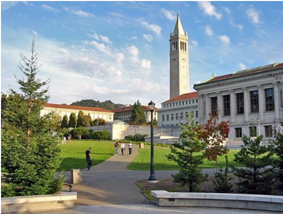
Fig. 4 Berkeley University

di dati, o approssimativamente 0.35 MB, che si sovrappongono nel